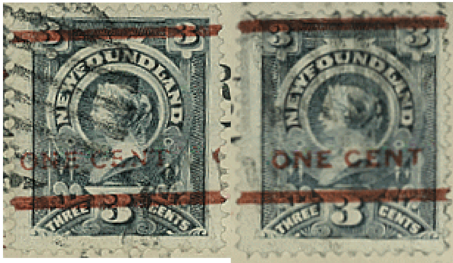
fig. F font B