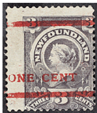
fig. E; off center sheet font B

Cinq feuilles furent surchargées en rouge.