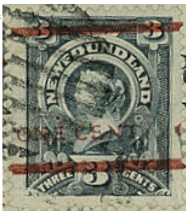
fig. F font B

La largeur des marges montre que ce timbre est différent des autres surcharges usagées, fig. G. Cet exemplaire montre que nous avons maintenant sept feuilles.