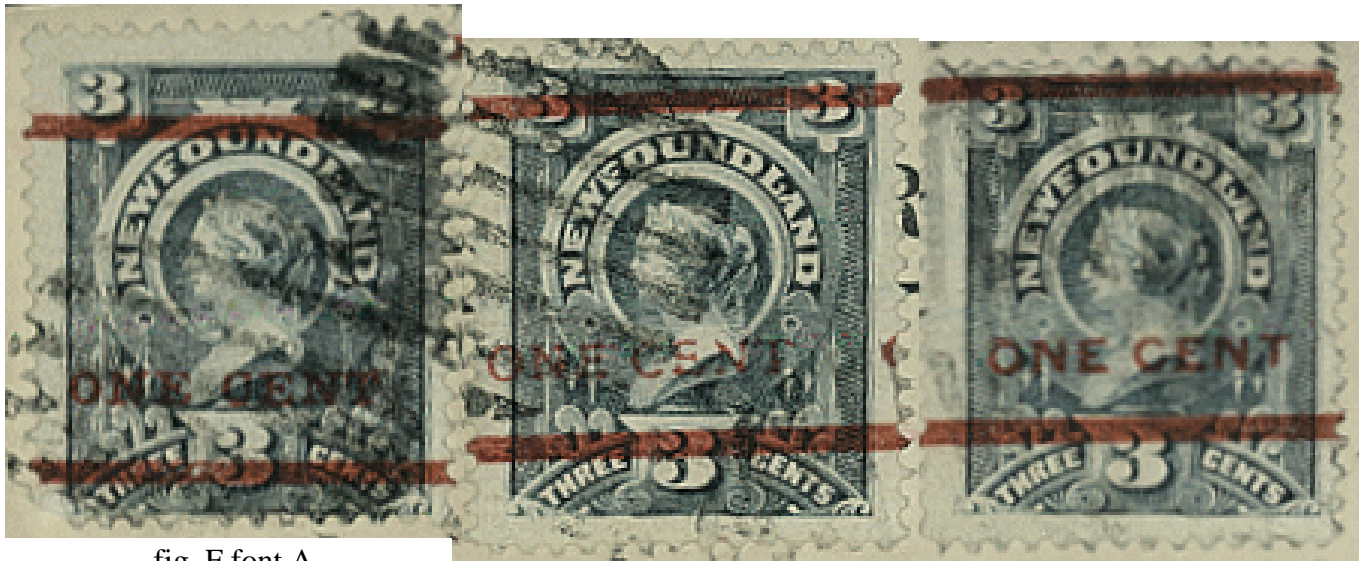
fig. F font A