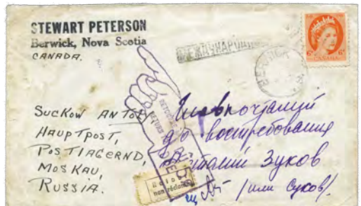
6¢ single-weight: first oz. [Only known example of 6¢ Wilding used for single-weight UPU surface letter to USSR. Marked 'International' and labeled 'Return unclaimed'; 5¢ postage due assessed for return fee in Canada.]