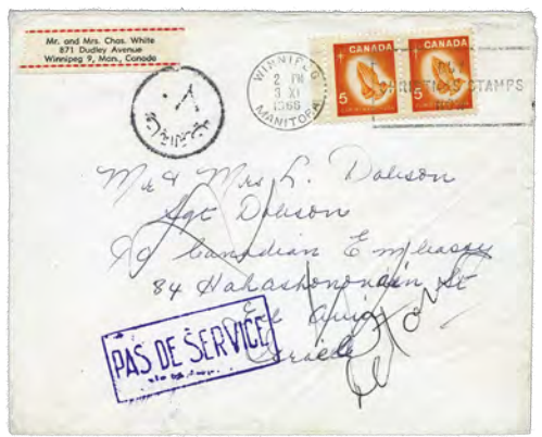
10¢ single weight: first oz. [Winnipeg-tagged 5¢ 1966 Christmas stamps. Addressed to Tel Aviv, Israel; returned from Cairo, Egypt, marked 'No Service'.]