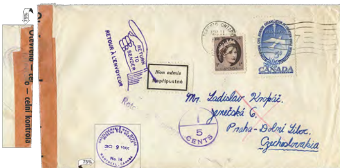
6¢ single-weight: first oz. [Opened for customs inspection, officially sealed, labeled 'Inadmissible', and returned to Canada. Undeliverable Mail Office assessed 5¢ postage due for return fee in Canada.]