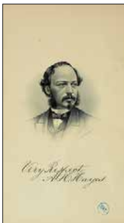
Portrait gravé sur la page frontispice du livre d'Albert Hamilton Hayes publié en 1870, A Medical Treatise on Nervous Affections (Traité médical sur les affections nerveuses).

Hayes croyait également que les médicaments étaient utilisés à mauvais escient et prescrits à tort dans le cas de certaines gênes nerveuses; selon lui, la belladone, le chloral, le bromure de potassium, l'aconit et même le thé étaient des médicaments mal utilisés. À cet égard, nous pourrions le considérer comme l'un des premiers thérapeutes de la médecine holistique. Mes recherches ont cependant révélé que la vente de ces mêmes médicaments était partie intégrante du gagne pain de Hayes.