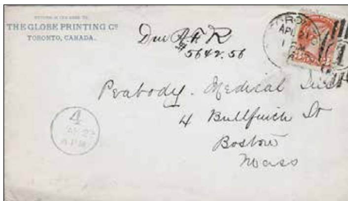
1. Affranchissement ordinaire sur une lettre de The Globe Printing. CDC de Toronto avec oblitération comportant le chiffre 1 au centre. Arrivée à Boston 27 heures après avoir été postée de Toronto.