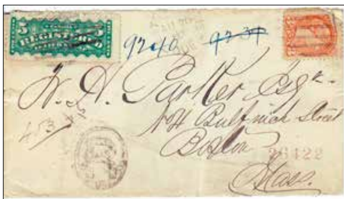
Le seul pli conforme aux règlements postaux. Le timbre de 5 ¢ pour lettre recommandée est correctement placé dans le coin supérieur gauche et le timbre ordinaire petite reine de 3 ¢ se trouve dans le coin supérieur droit. Oblitération en cercle interrompu de Québec, rayure d'oblitération, ovale avec le « R ».

Les commis devaient aussi écrire sur l'enveloppe un numéro correspondant à celui qui était écrit dans le registre du courrier recommandé expédié. Un seul numéro était inscrit sur dix des plis, douze avaient deux numéros, sept en avaient trois, quatre en avaient quatre et deux en avaient cinq. Les numéros supplémentaires servaient sans doute à la documentation des bureaux de poste où un transit avait lieu.