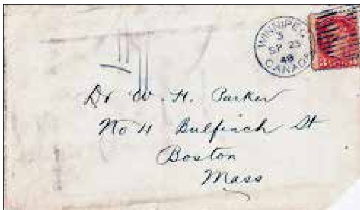
La date du CDC de Winnipeg est 1848, ce qui est une erreur. Le timbre petite reine de trois cents a été émis en 1870 seulement.

Les commis devaient étamper l'enveloppe à la main avec le mot « RECOMMANDÉ » ou avec un cercle ou un ovale comportant la lettre « R » au centre. Vingt des plis recommandés avaient l'étampe manuelle « RECOMMANDÉ ». Sur l'un des vingt plis, un encadré mettait en évidence le mot « RECOMMANDÉ ». Huit plis comportaient une étampe manuelle ovale représentant la lettre « R » et tous avaient été postés à partir de l'année 1886. Trois des plis ne portaient pas de mention « RECOMMANDÉ », mais cette dernière avait été écrite à la main sur deux autres.