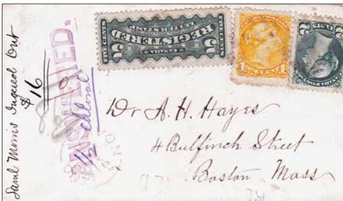
Lettre recommandée de Samuel Morris postée à Avon en Ontario. Note « Answered » (répondue) étampée à la main en pourpre et 16 $ écrit à l'encre noire; « 1/2 chloral » fait référence à une dose de chloral prescrite.